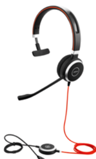
JABRA EVOLVE 40 MONO I DUO 1