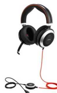
JABRA EVOLVE 80 MS STEREO

1 Dostępne warianty dla Skype for Business