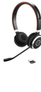
JABRA EVOLVE 65 MONO I DUO 1