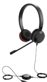
JABRA EVOLVE 30 MONO I DUO 1