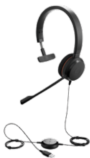
JABRA EVOLVE 20 MONO I DUO 1